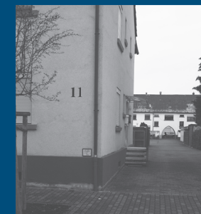
Wohnhaus der Familie Stoll