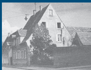
Wohnhaus der Familie Halle